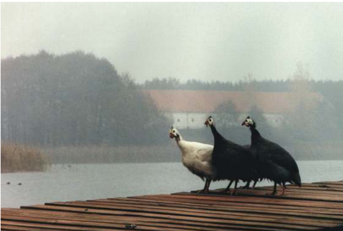
MATEUSZ ZIELI SKI