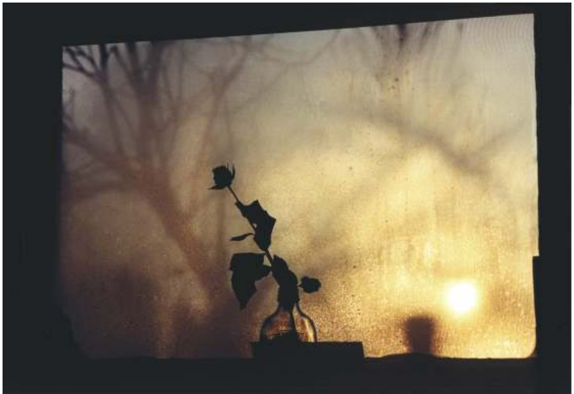
MACIEJ PACZKOWSKI II nagroda