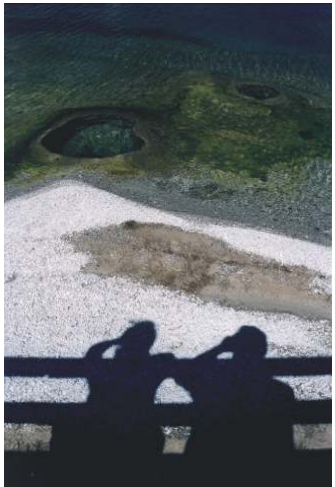
ARTUR KAMI SKI III nagroda