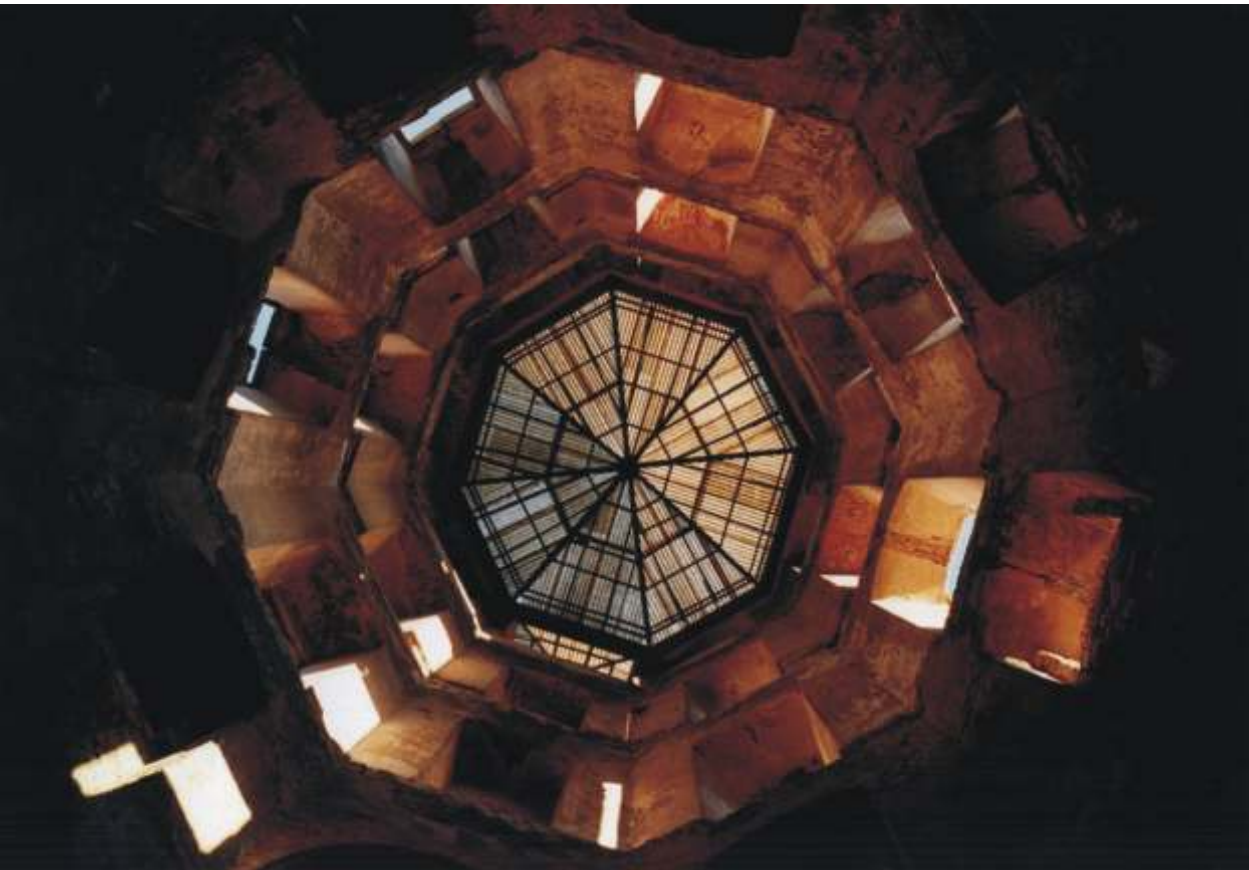
JAROSŁAW MARKOWSKI III nagroda