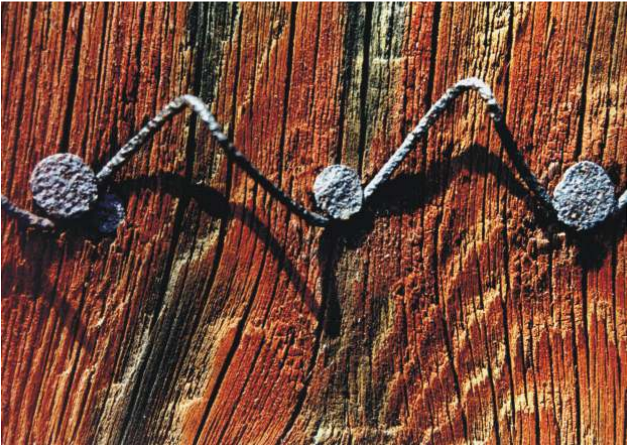
ARTUR KAMI SKI III nagroda