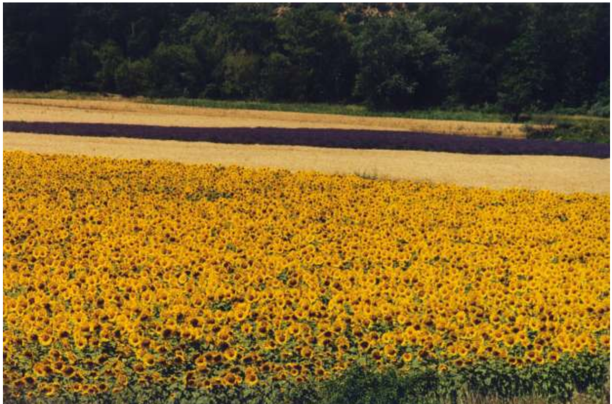
ANDRZEJ LIS II nagroda