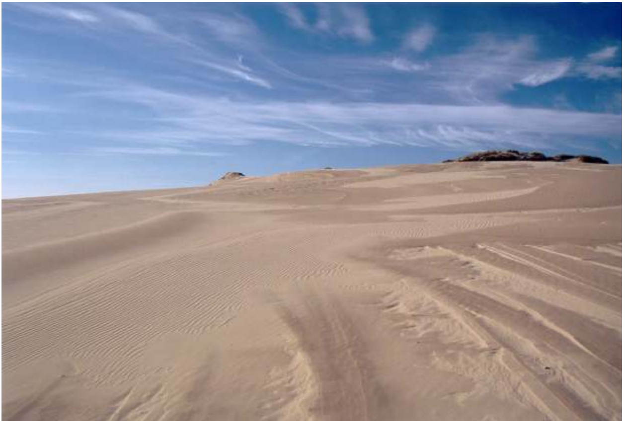
PIOTR KOWALSKI I nagroda