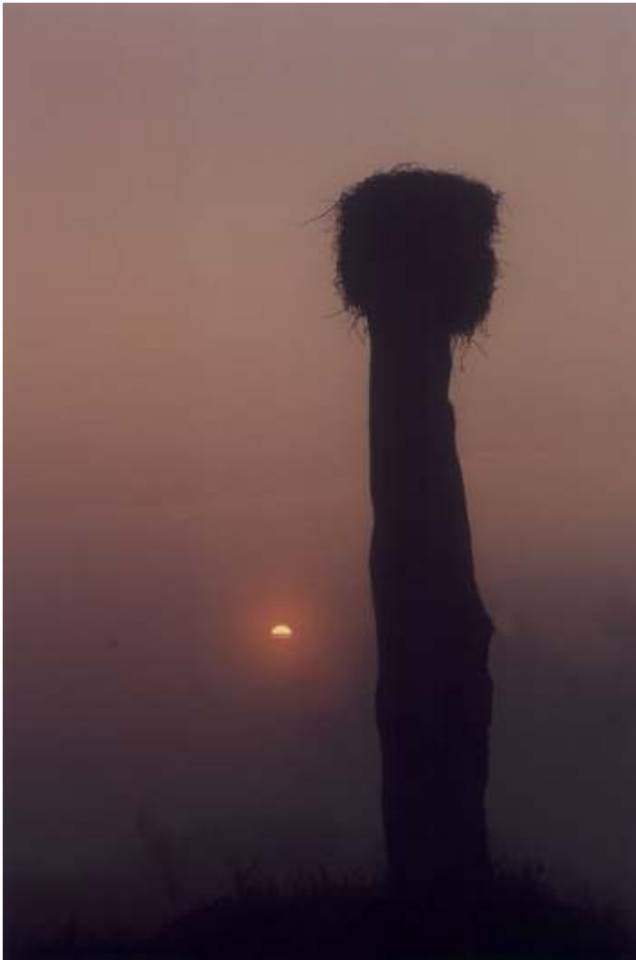
JACEK RUTA III nagroda