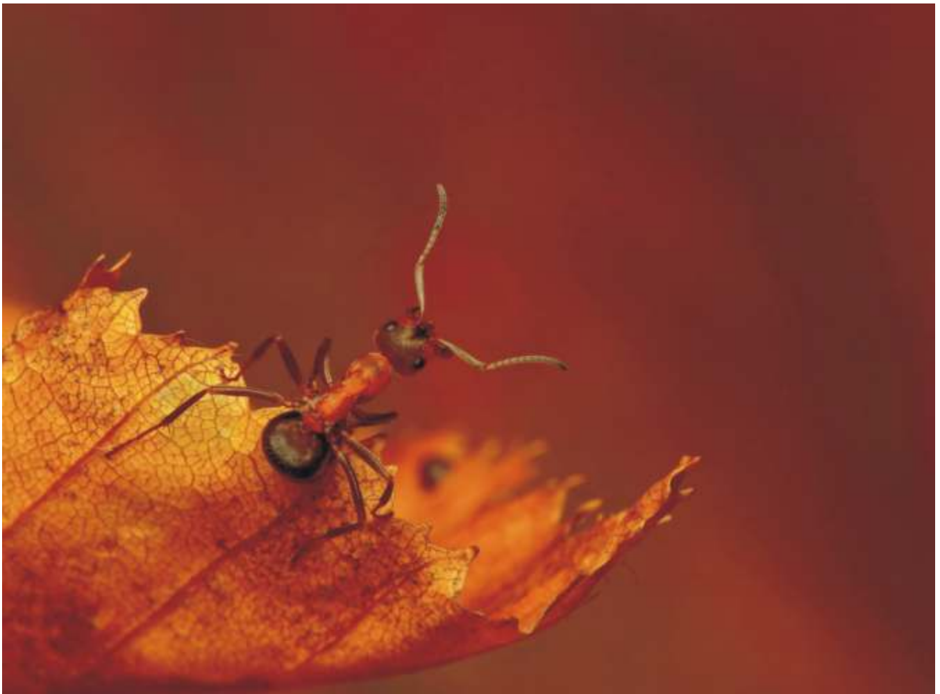
PAWEŁ BIENIEWSKI "Barwy jesieni" wyró nienie