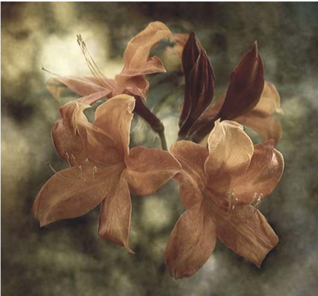
EWA CEGLAREK "Azalia 1" nagroda specjalna wydawca FOTO i FOTOGRAFIA CYFROWA