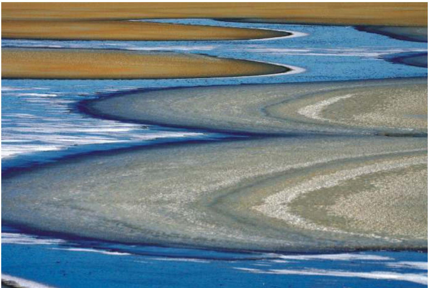
ANNA WOROWSKA "Tafla 2"