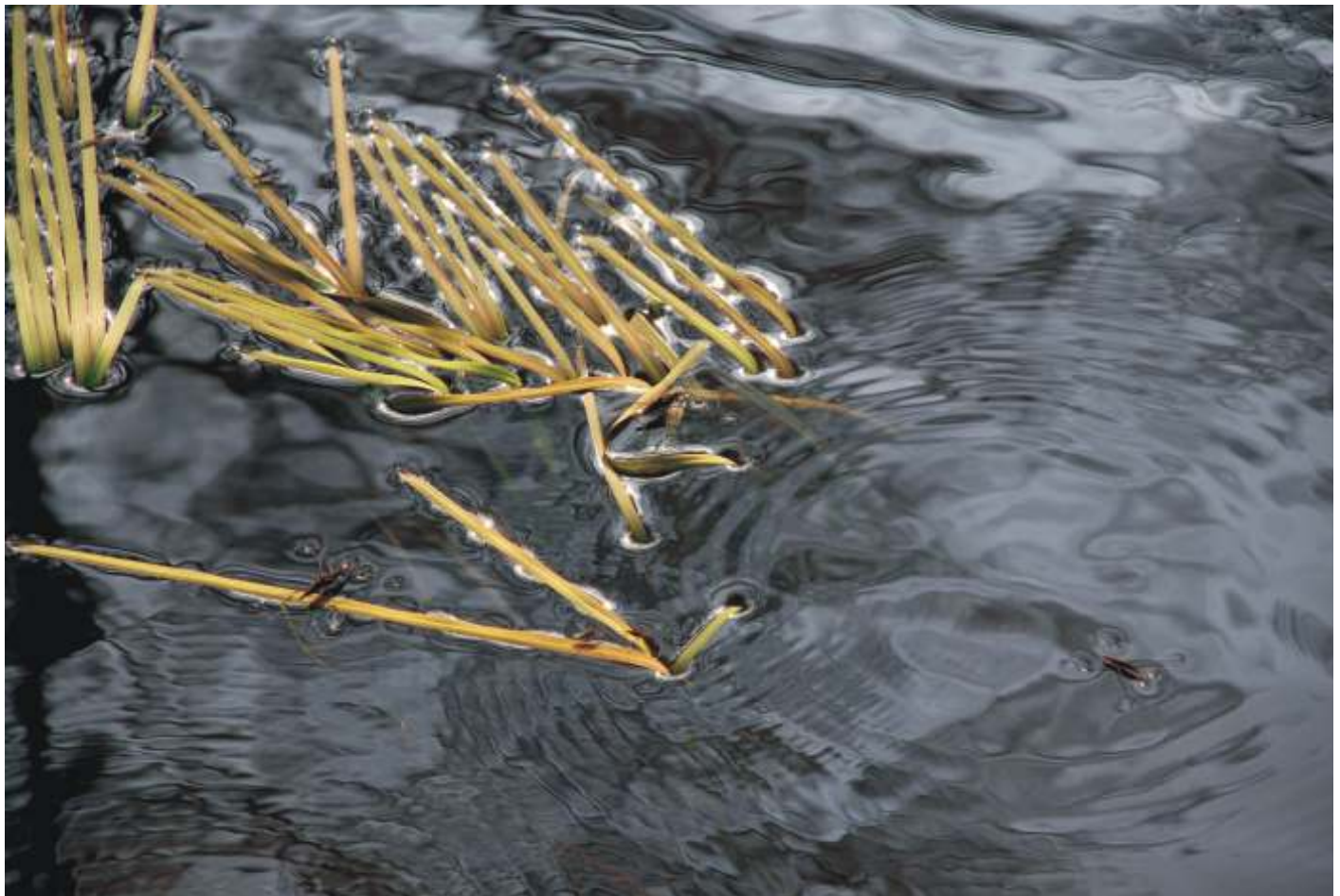
EL BIETA PYRKA " lizgi po wodzie"