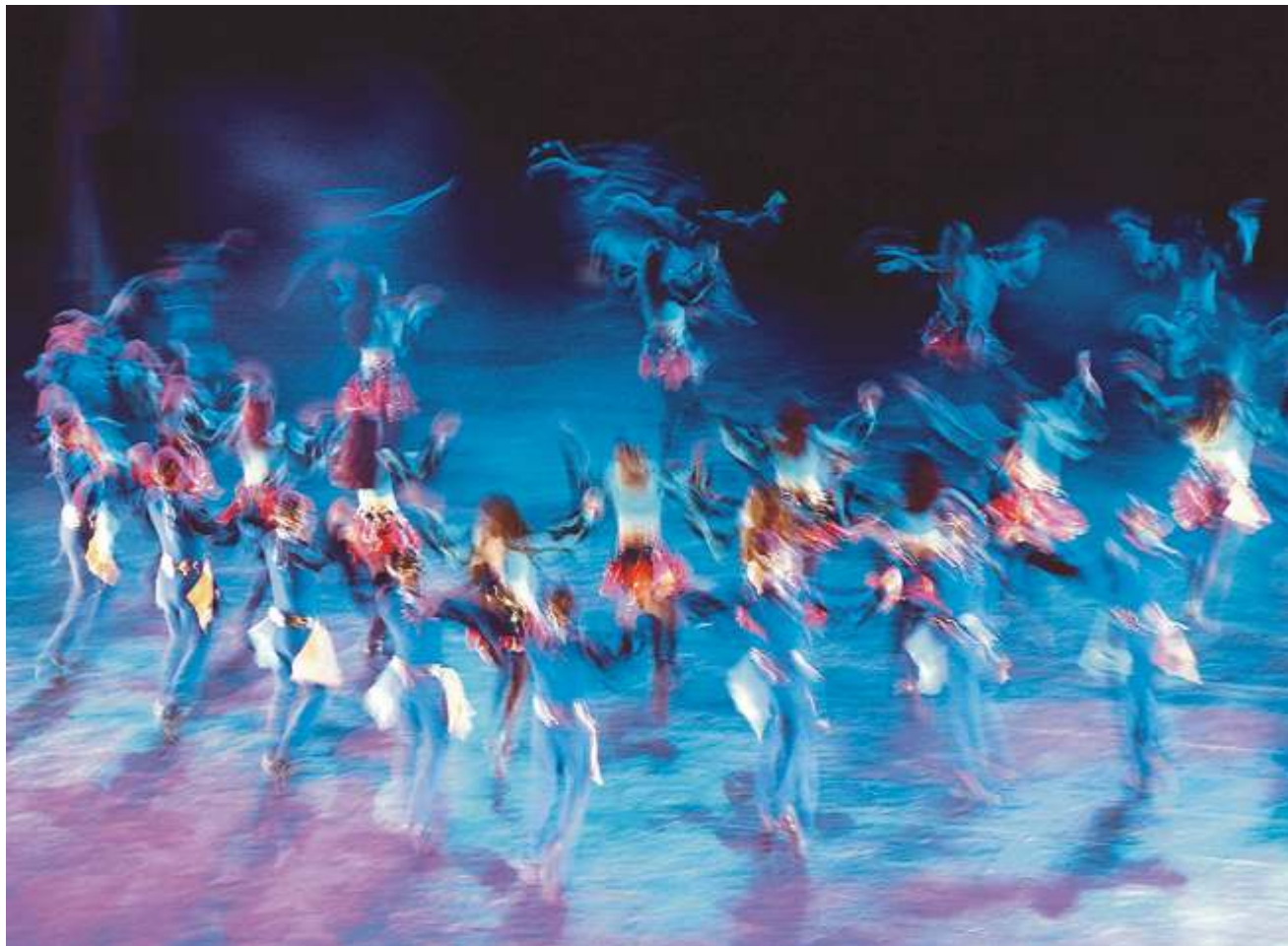
EL BIETA WASZCZUK "Marzenia senne 3"

JAROSŁAW GWO DZIK "XXX" nagroda specjalna wydawca FOTO i FOTOGRAFIA CYFROWA