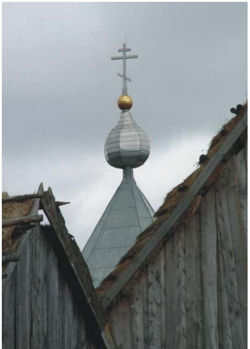
WOYTEK SMÓŁKOWSKI "XXX" wyró nienie