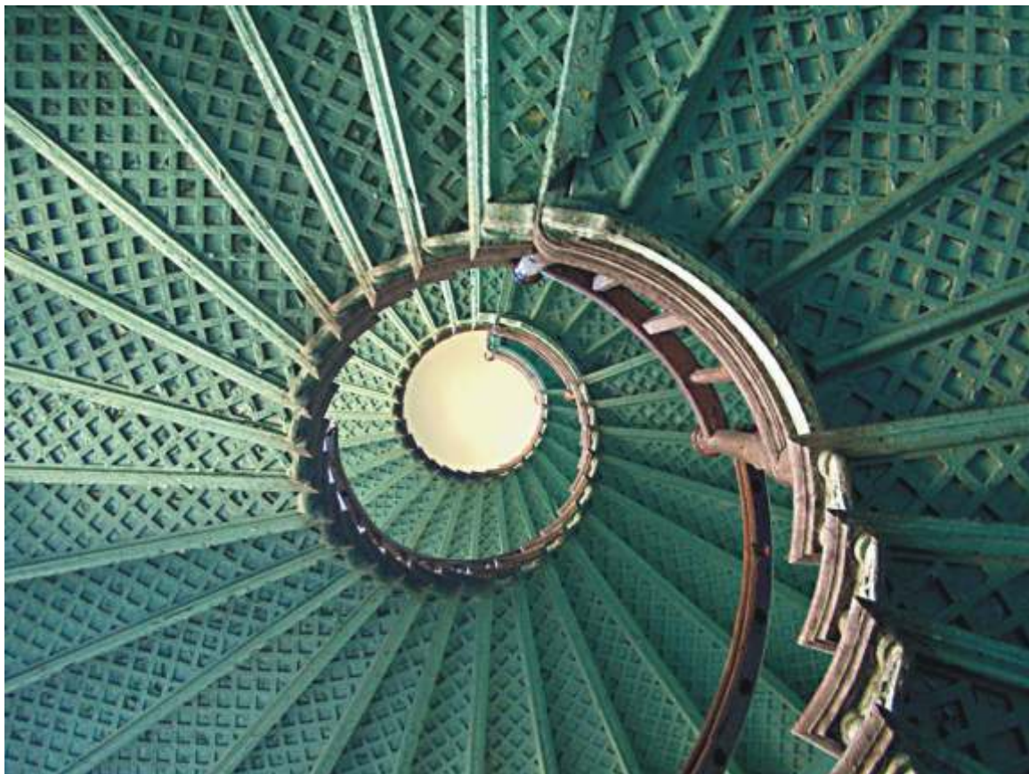
IWONA CZERNIAK "Droga do domu"