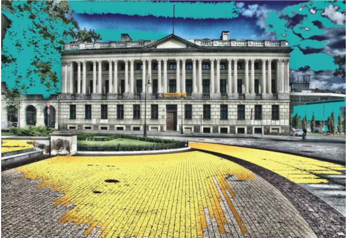
Biblioteka Raczyńskich Raczyńskich Könyvtár the Raczyński library