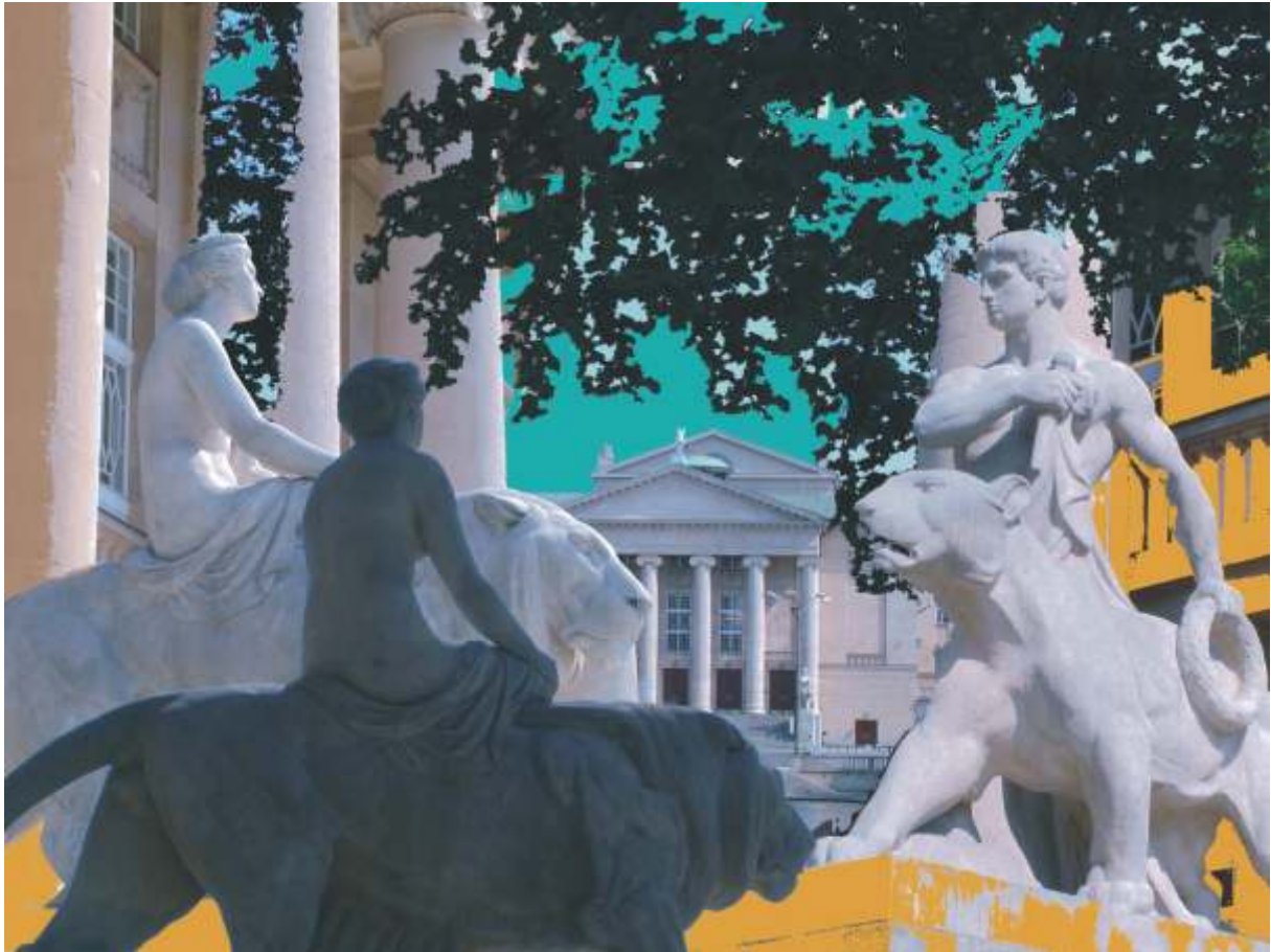
Teatr Wielki Nagyszőlősz the Grand Theatre