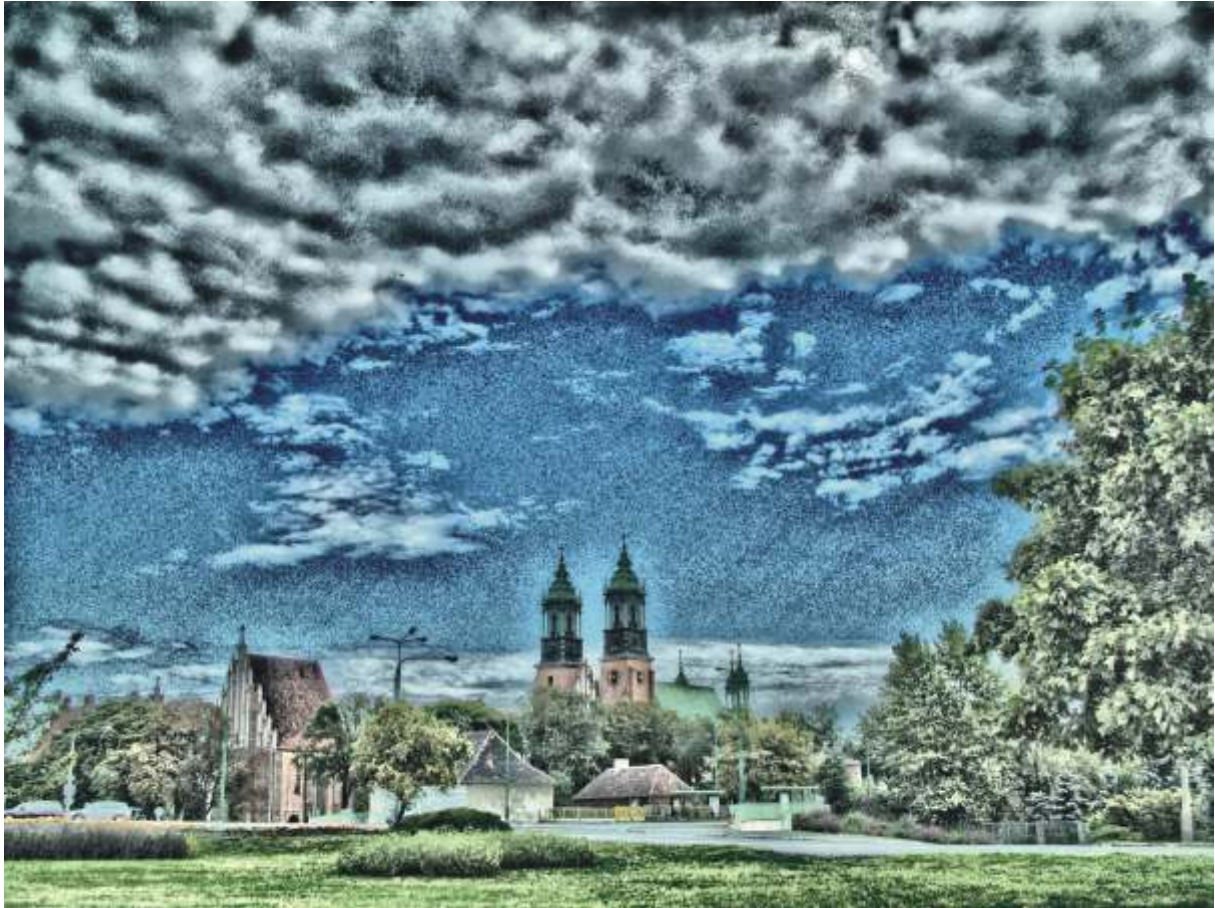
Katedra Katedr?lis the Cathedral