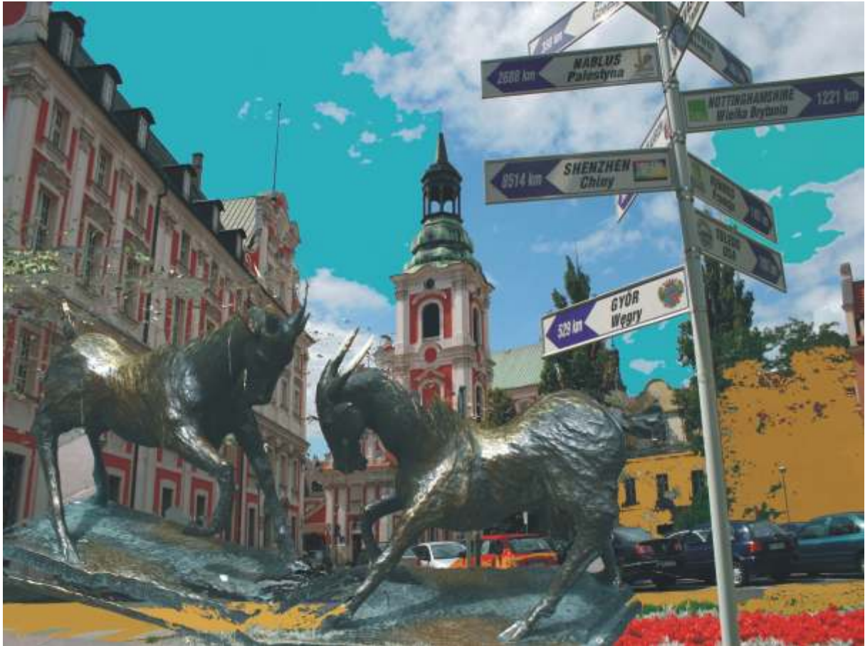
Plac Kolegiacki Kolegiacki tér the Kolegiacki square