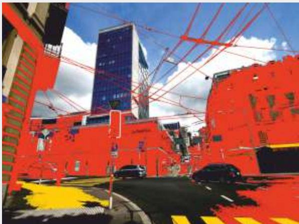
© Antoni Rut „W sieci codzienności 9”, foto-grafika 45 x 60 cm.