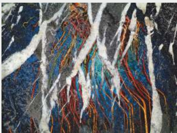
© Antoni Rut „W sieci codzienności 15”, foto-grafika 45 x 60 cm.