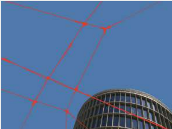
© Antoni Rut „W sieci codzienności 6”, foto-grafika 45 x 60 cm.