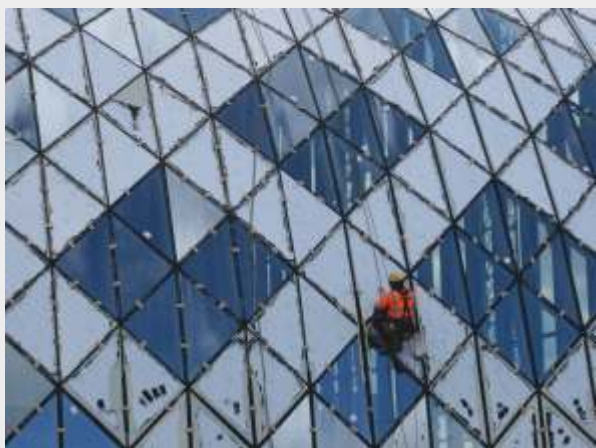
© Antoni Rut „W sieci codzienności 26”, foto-grafika 45 x 60 cm.