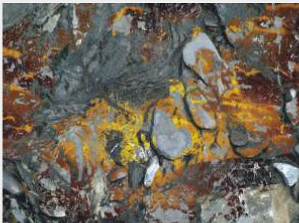
© Antoni Rut „W sieci codzienności 14”, foto-grafika 45 x 60 cm.