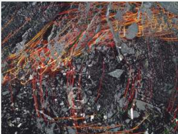
© Antoni Rut „W sieci codzienności 16”, foto-grafika 45 x 60 cm.