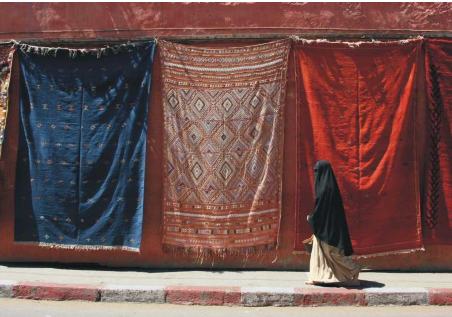
MIROSLAW MIZERA "XXX" I nagroda i Złoty Medal