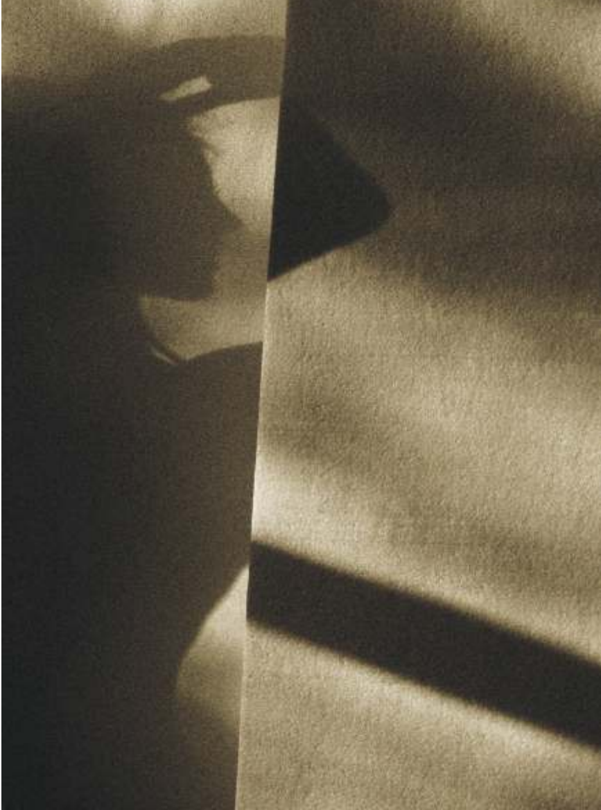
JUSTYNA BAJGROWICZ "autoportret"