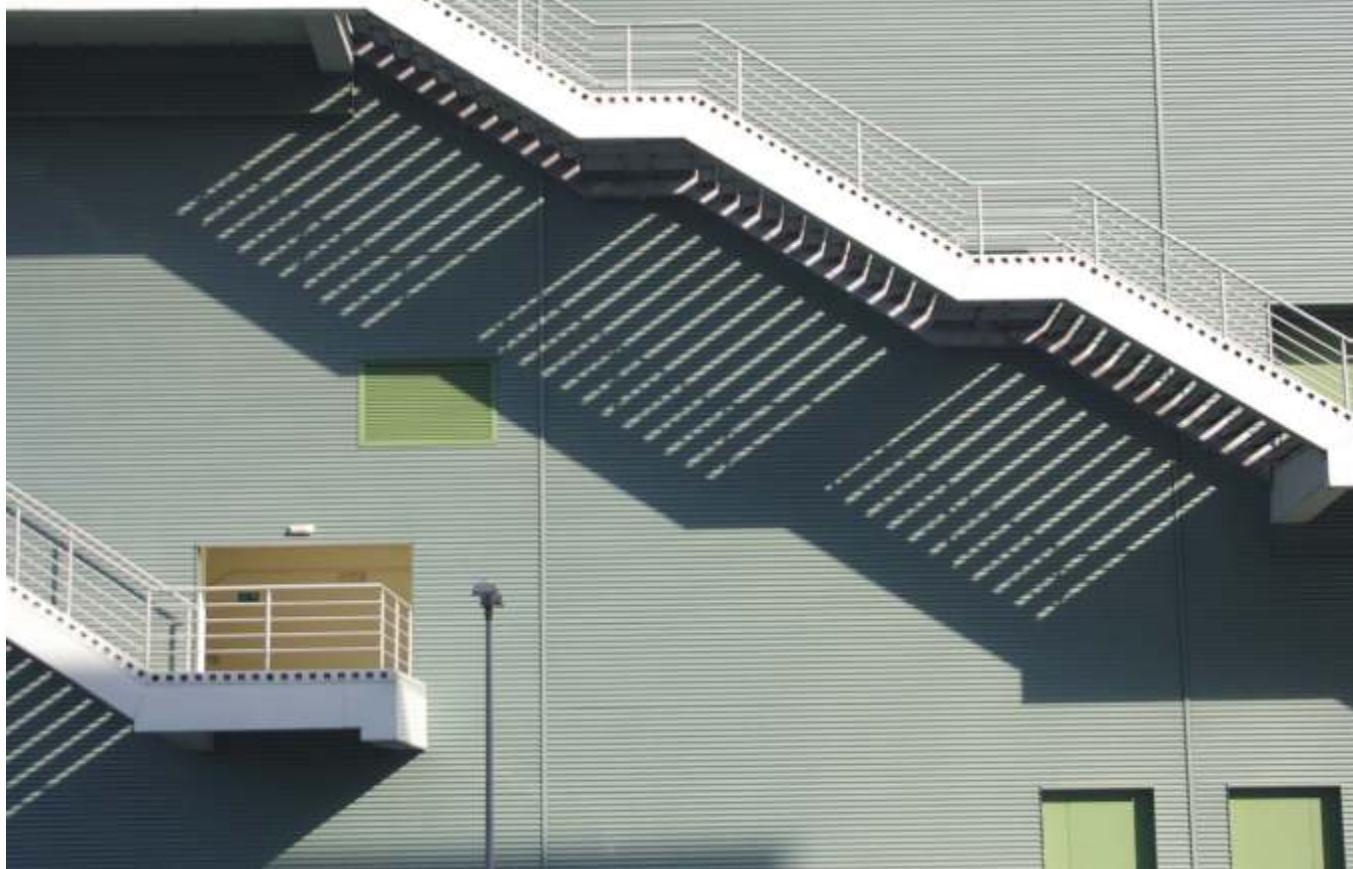
CEZARY DUBIEL "Architektura ery handlu globalnego Galaxy 3" wyróżnienie