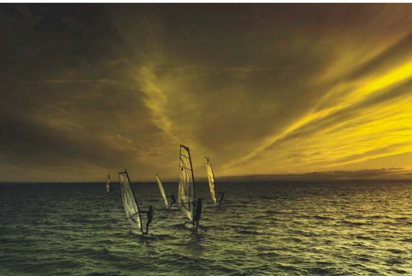
JOANNA RYBCZY SKA "Znaki 3" wyró nienie