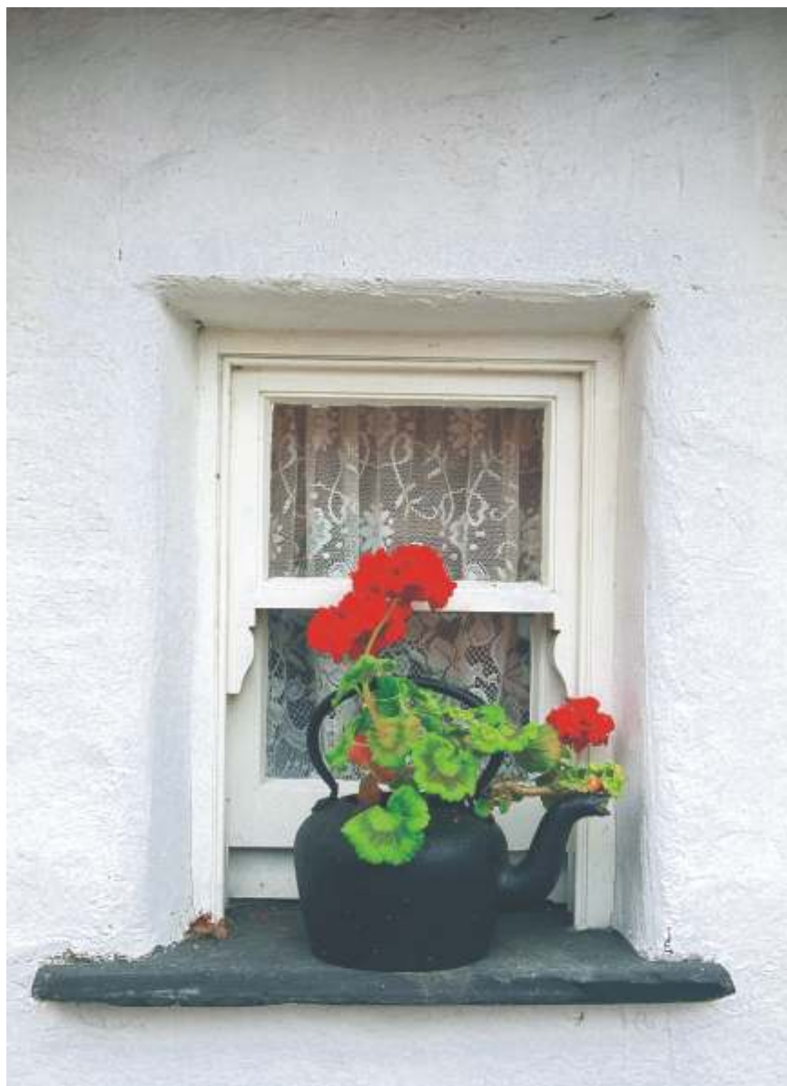
MAŁGORZATA SOKAŁA "XXX"