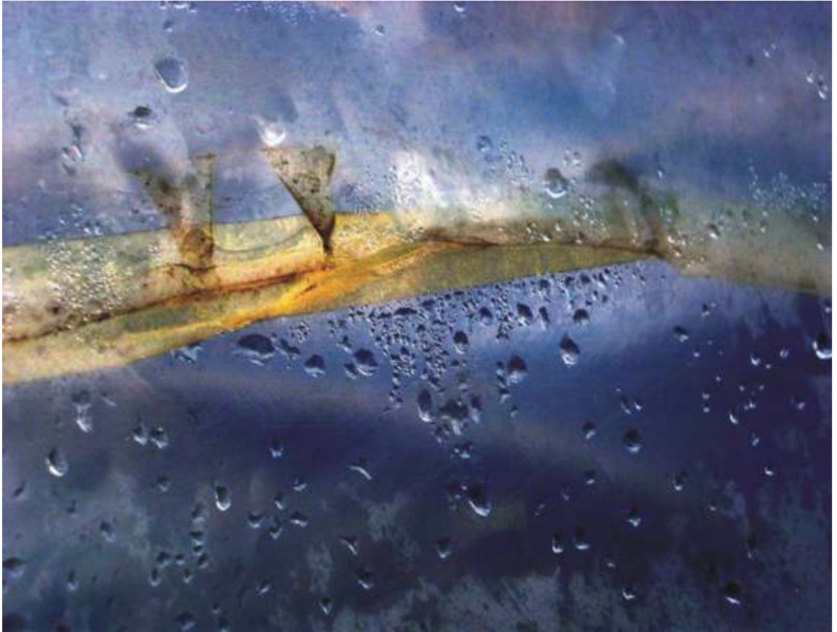
EDYTA LISEK "Przestrzeniej mojej wyobraźni"

MAŁGORZATA KŁAFKOWSKA "Susza" nagroda specjalna FOTODURA Salon Fotograficzny