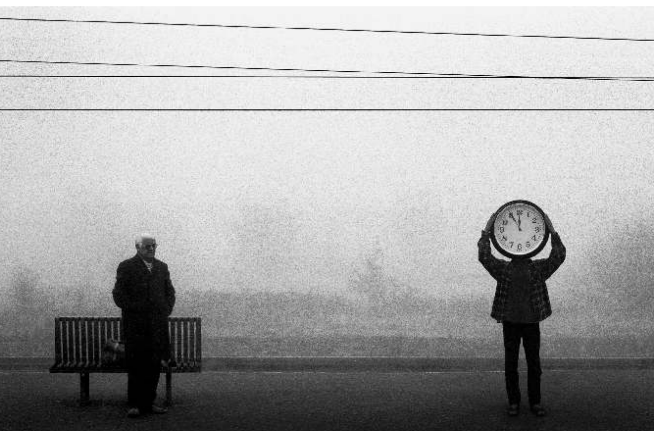
DARIUSZ KLIMCZAK "Czas odjazdu"