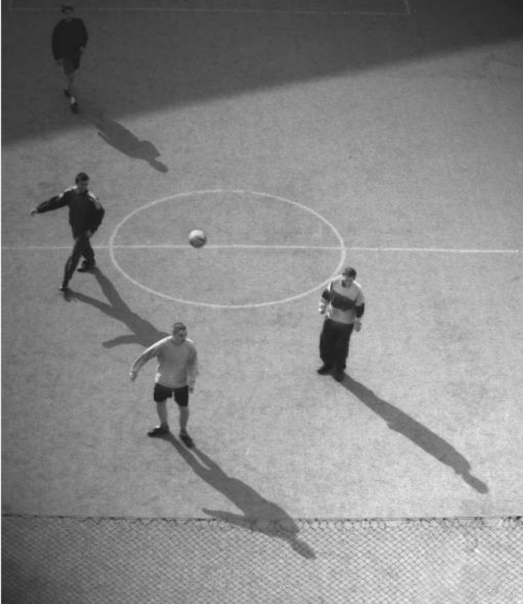
NATALIA LEWANDOWSKA "XXX" Dyplom Biuletynu Fotograficznego