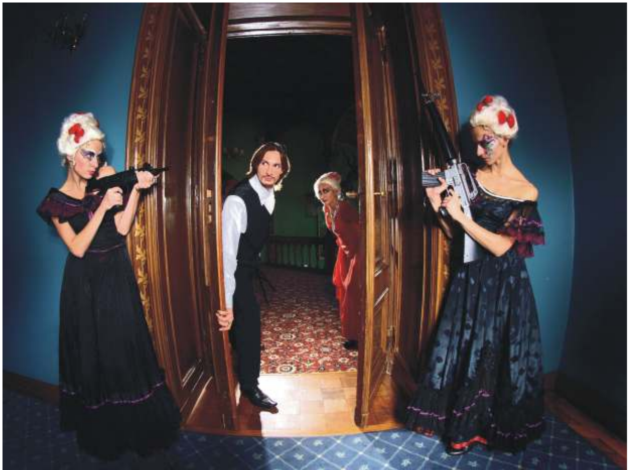
JAROSŁAW GWO DZIK "Sceny pałacowe IV" I nagroda i Złoty Medal