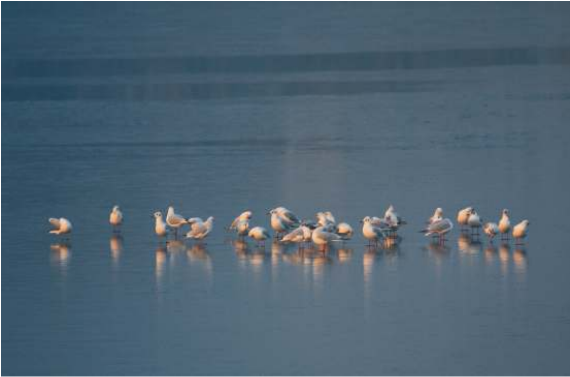
WITOLD KRÓL "Mewy na lodzie" Wyró nienie