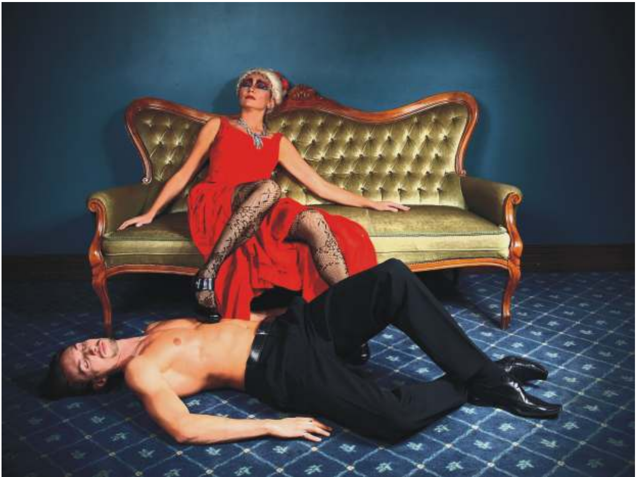
JAROSŁAW GWO DZIK "Sceny pałacowe III" I nagroda i Złoty Medal