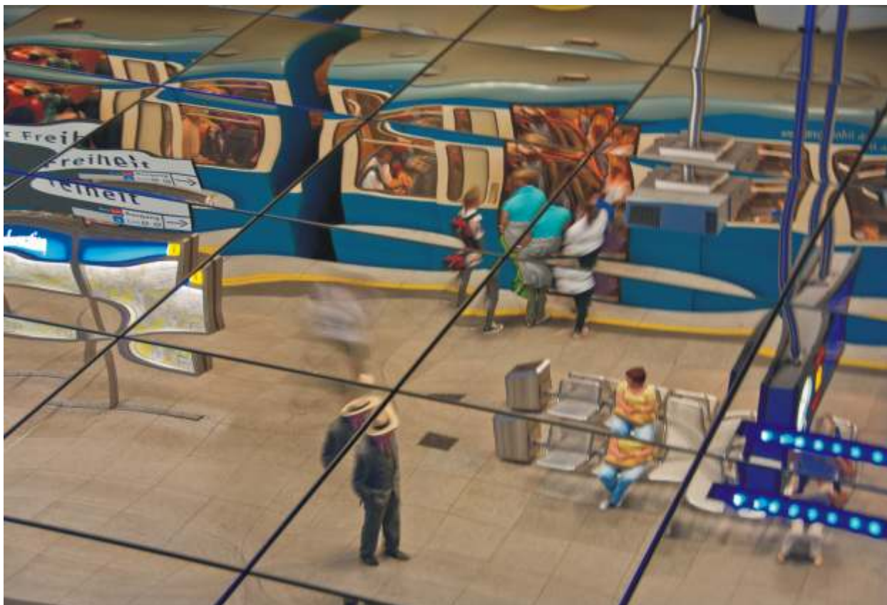
TOMASZ JUSZKIEWICZ "Po drugiej stronie l" Wyró nienie