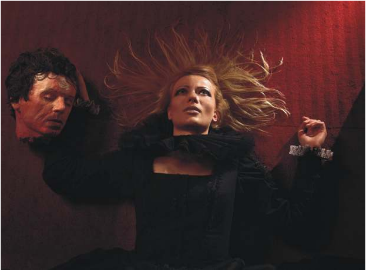
JAROSŁAW GWO DZIK "Sceny pałacowe IX" I nagroda i Złoty Medal