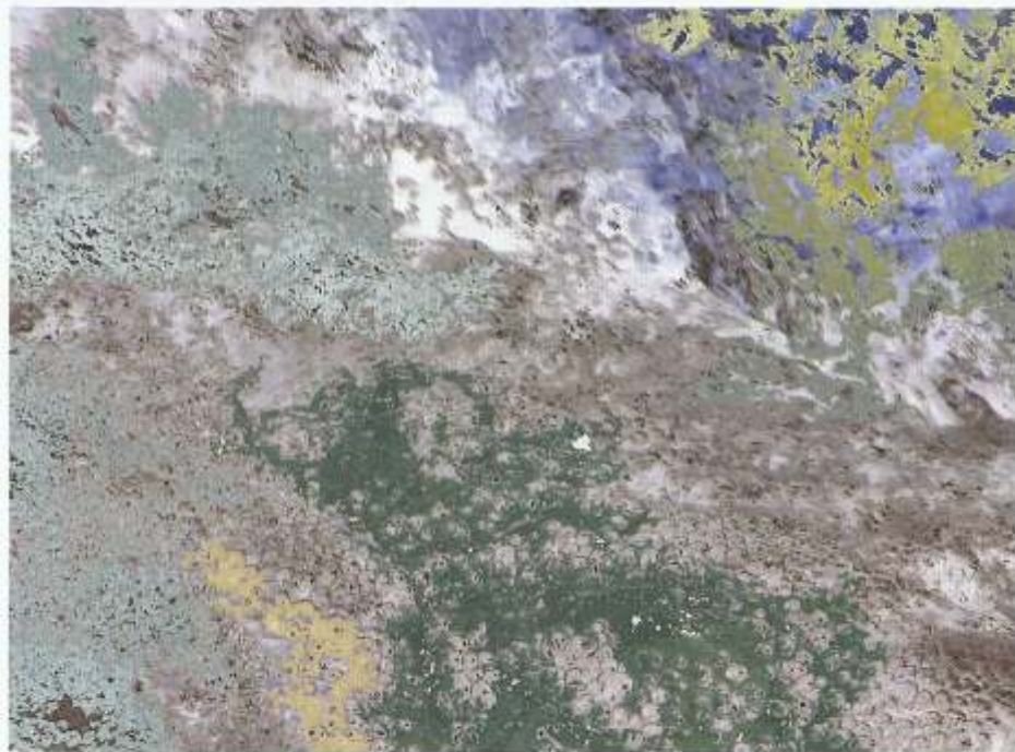
© Antoni Rut. Rytmy I, foto-grafika 45x60