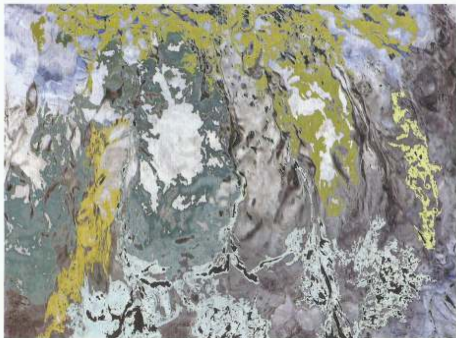
© Antoni Rut. Rytmy II, foto-grafika 45x60