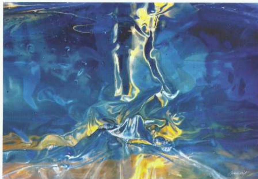
© Antoni Rut, Labirynty przestrzeni VIII, fotografia 70x100cm