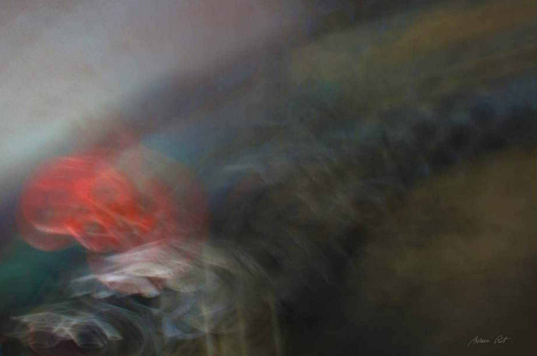
© Antoni Rut. Rhythms of Light V, fotografia 70x100cm