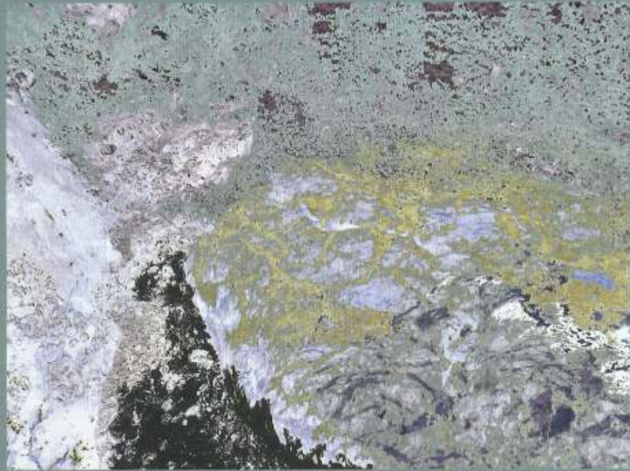
© Antoni Rut, Rytmy II, foto-grafika 45x60