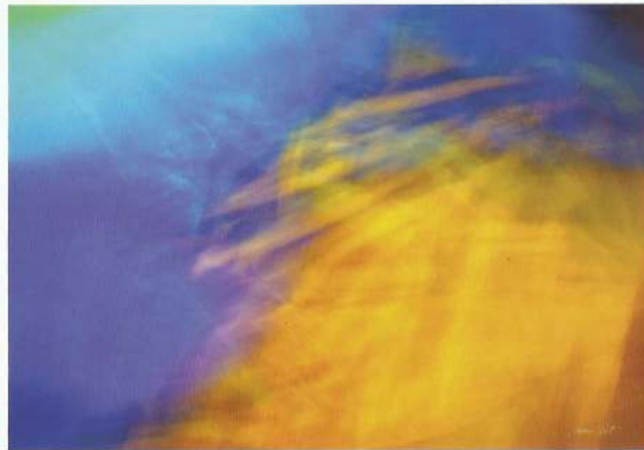
© Antoni Rut. Rytmy światów III, fotografia 70x100cm