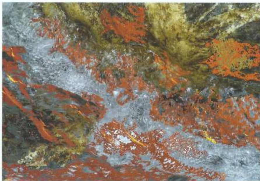
© Antoni Rut, Labirynty przestrzeni VI, foto-grafika 70x100cm.