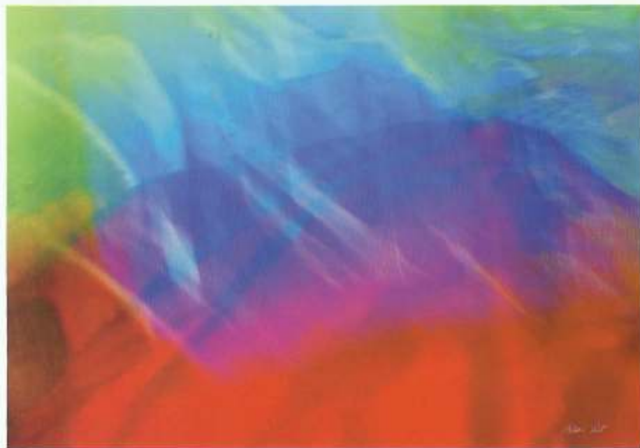
© Antoni Rut. Rytmy światów II, fotografia 70x100cm